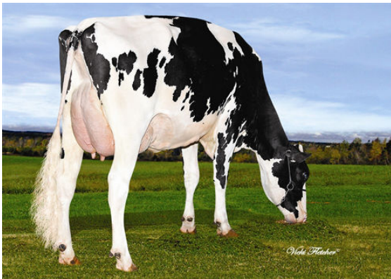
VALRUEST LAVAMAN LILO