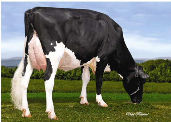
GEN-I-BEQ LAVAMAN BASILIC