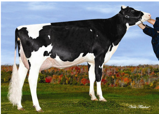
REDLODGE LAVAMAN PIPPA